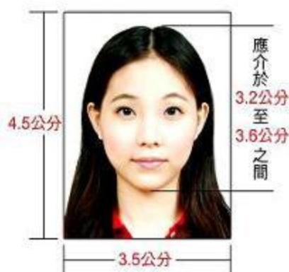
符合规格照片 (實際尺寸)