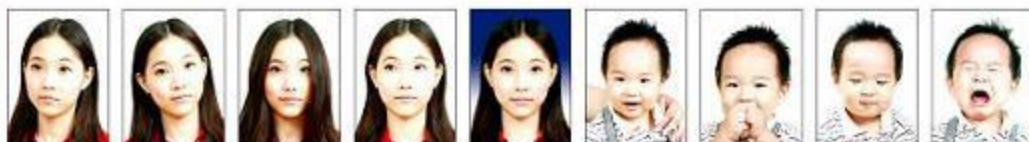
頭部側向 一邊、未 正視鏡頭